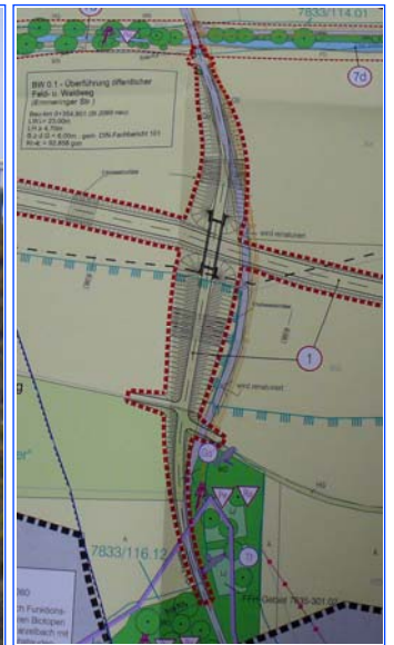
Die Südwestumfahrung zerstört das Naherholungsgebiet am Starzelbach und beschädigt das Landschaftsbild in hohem Maße